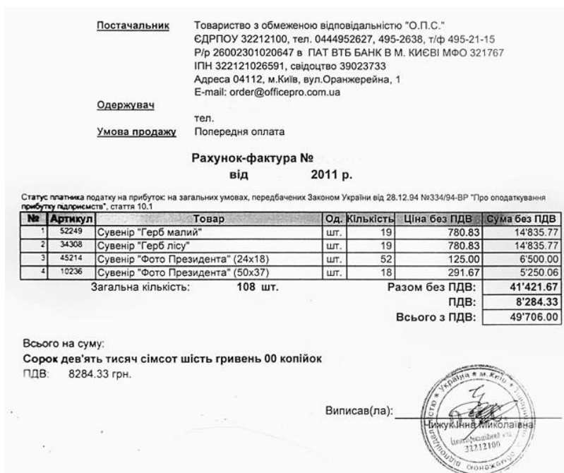
Рис.2 Зразки рахунку-фактури

Після отримання ТРЬОХ цінових пропозицій Бенефіціар має здійснити такі кроки: