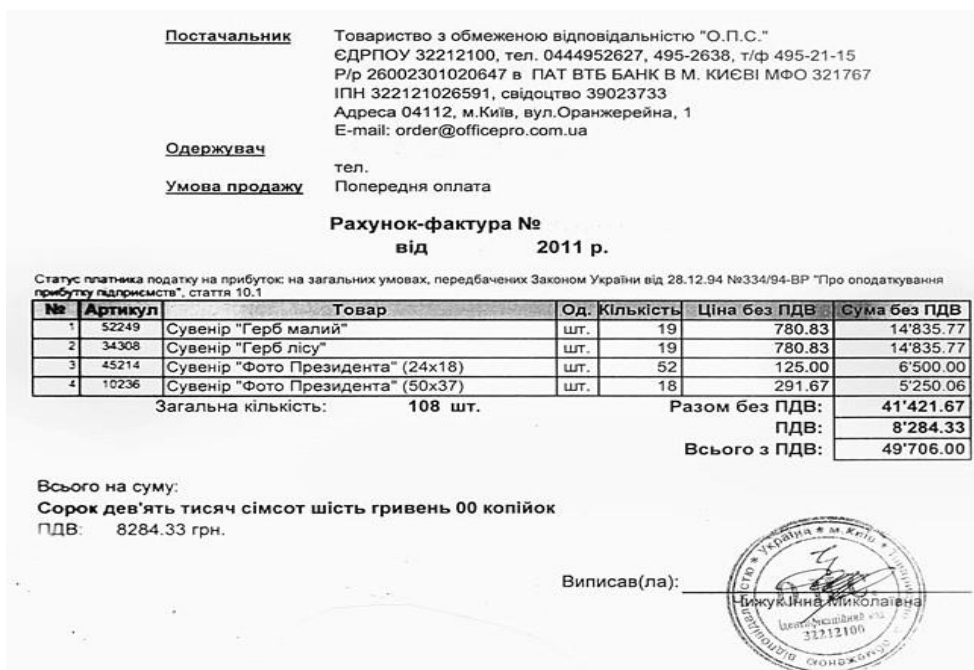
Рис.2 Зразки рахунку-фактури

Після отримання ТРЬОХ цінових пропозицій Бенефіціар має здійснити такі кроки: